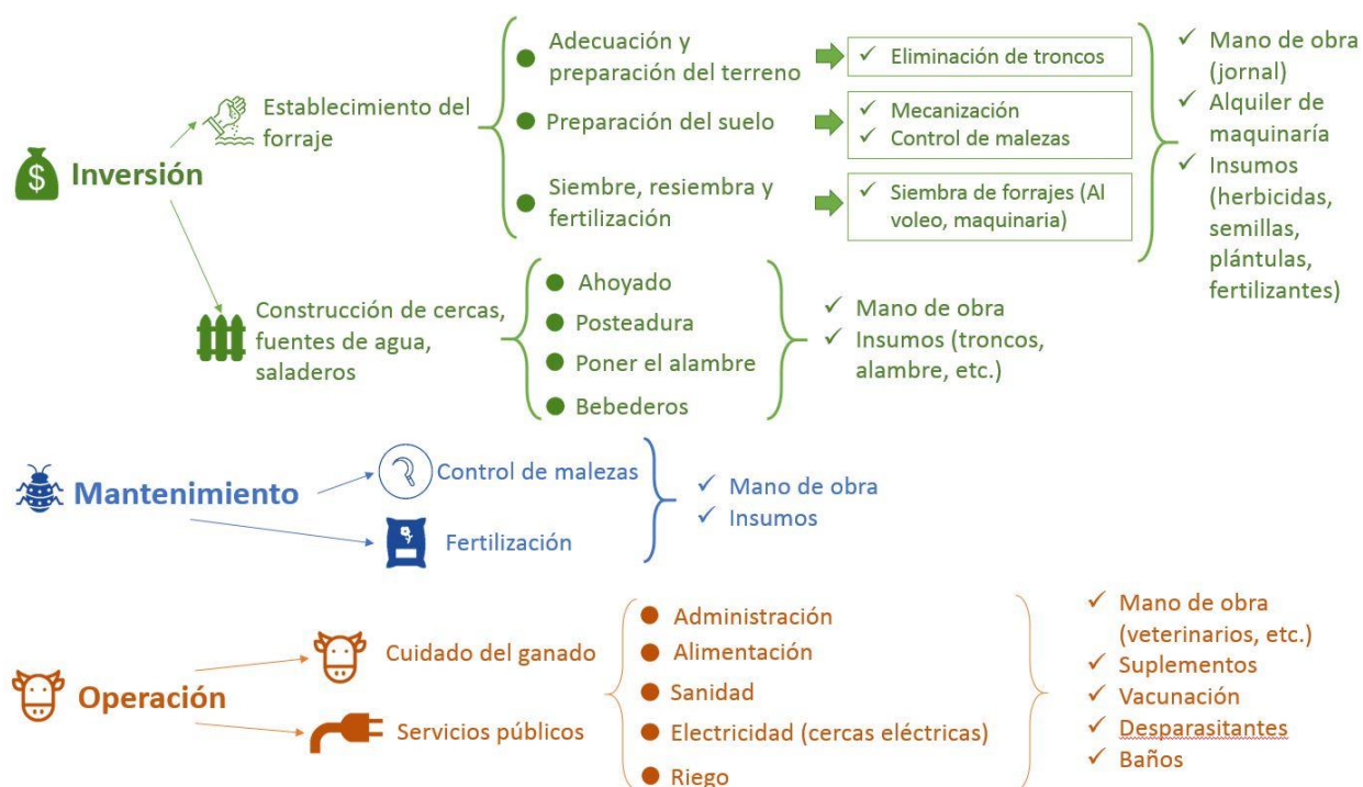
Figura 2. Costos de inversión, mantenimiento y operación de tecnologías forrajeras