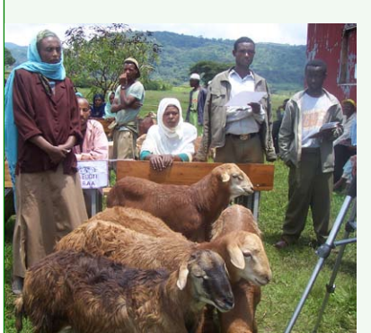
ሚስኩ - በግ መሸጥ በማህበረሰቡ ዕውቅናን አስገኘ

በግብርናና ገጠር ልማት ቢሮና በምርታማነትና ገበያ ስኬት ማሻሻያ ፕሮጀክት አዘጋጅነት በሁሉም የገበሬ ማህበራት ውስጥ የሚገኙ ሴት አርሶ አደሮች በወተት ምርት፣ በአትክልትና በንብ ማነብ ምርትና ገበያ ላይ ተሰማርተው ውጤታማ ወይም ምርጥ አምራች የሆኑ ሴት አርሶ አደሮችን እንዲጎበኙ የመስክ የጉብኝት ቀን በአድአ የመከራ ጣቢያ አዘጋጅቶ ነበር። ይህ ዝግጅት ሴቶች ዕውቀታቸውንና ክህሎታቸውን በአግባቡ ከተጠቀሙ ምን ያህል ውጤታማ ሊሆኑ እንደሚችሉ በወረዳው ለሚገኙ ሴት አርሶ አደሮች ለማሳየት አስችሎአል።