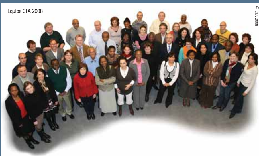
Equipe CTA 2008