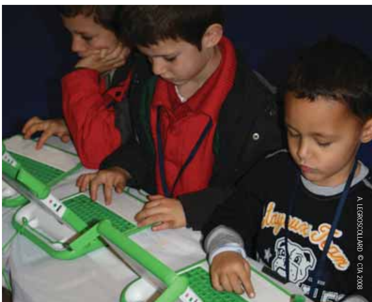
A. LEEROSQUILLARD © CTA 2008

Independentemente da aplicabilidade do portátil XO na agricultura e áreas rurais, ele tem o mérito de ter despoletado uma miríade de portáteis de baixo custo no mercado. O surgimento de telemóveis – com funções antes apenas oferecidas por computadores ou Agendas Digitais Pessoais (PDAs) encorajam-nos. Continuaremos com os nossos esforços nesta área.