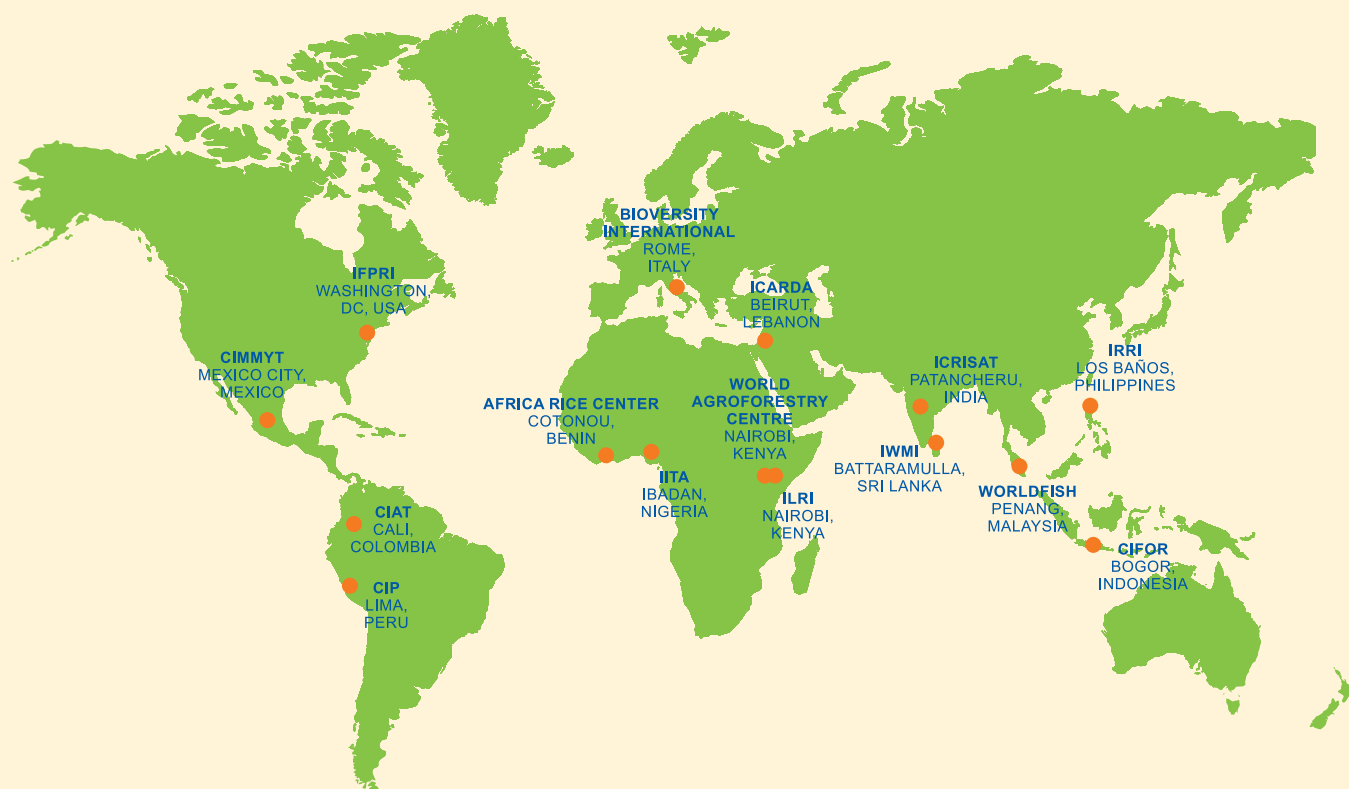
Carte de l'implantation des 15 centres de recherche dans le monde

Ces missions sont réalisées par 15 centres de recherche, qui sont membres du Consortium du CGIAR, en étroite collaboration avec des centaines d'organisations partenaires, y compris les instituts nationaux et régionaux de recherche, des organisations de la société civile, les milieux universitaires et le secteur privé.