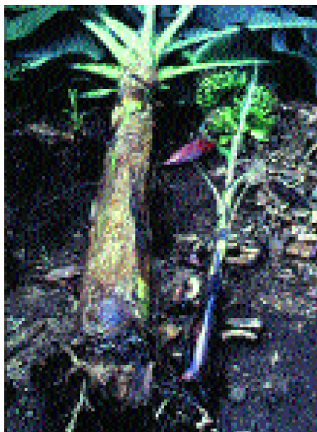
4. Chute de bananier due à la destruction des racines.