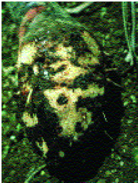
3. Nécroses sur souches (black head disease).

sept semaines d'inondation peuvent être aussi efficaces que 10-12 mois de jachère. Cependant l'inondation est rarement réalisable car elle requiert un terrain parfaitement plan et une alimentation permanente en eau. La fumigation du sol est très efficace contre les nématodes, toutefois peu de composés sont encore autorisés et les coûts d'application peuvent être élevés. De plus, les fumigants sont des biocides non-sélectifs ayant des effets négatifs sur la biologie des sols.