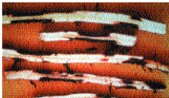
2. Nécroses sur racines. Toute l'épaisseur du parenchyme cortical peut-être atteinte, mais le cylindre central est indemne.

la croissance et du développement des plants. Cela peut entraîner de sévères réductions du poids des régimes et accroître l'intervalle de temps entre deux récoltes. De plus, la destruction des racines diminue l'ancrage des plants dans le sol, augmentant les risques de chutes (Photo 4), particulièrement lors des périodes cycloniques, avec un fort impact économique.