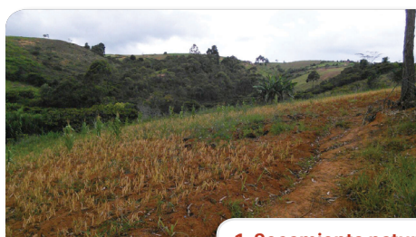
1. Secamiento natural