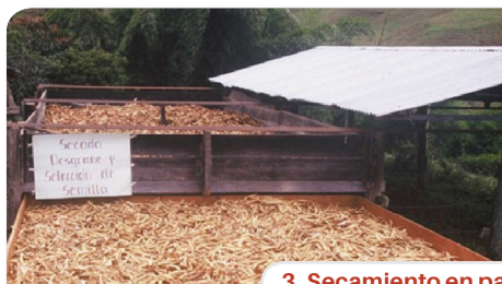
3. Secamiento en paseras o secaderos de café