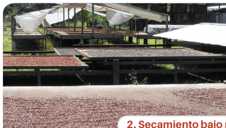
2. Secamiento bajo marquesinas o coberturas plásticas