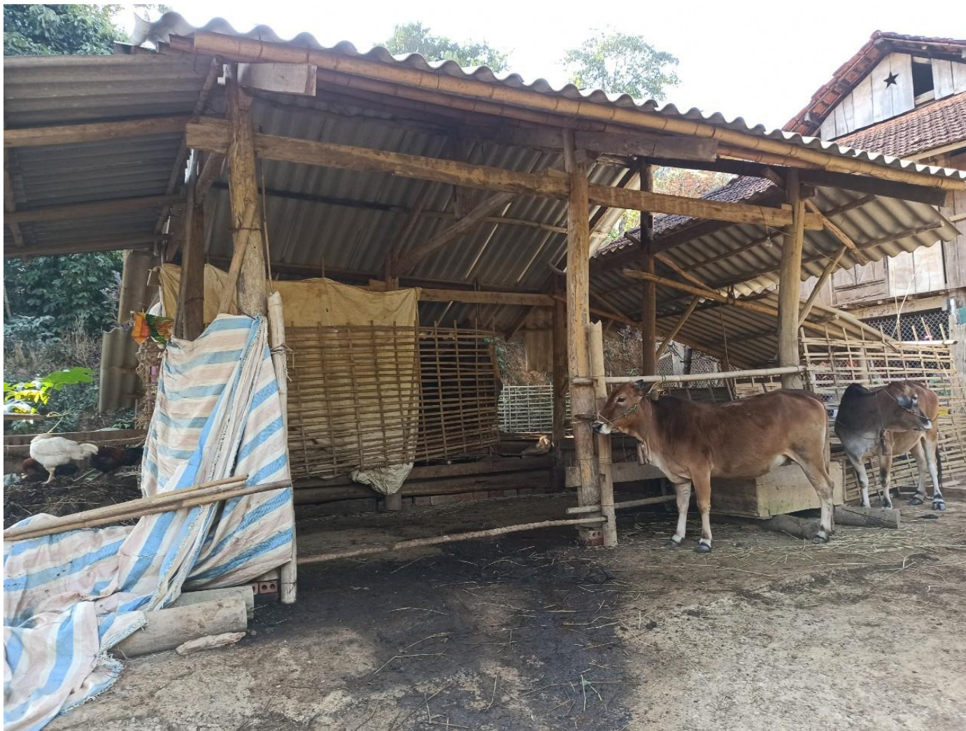
Chuồng nuôi bò của một hộ dân tại bản Khoa, Chiềng Chung – Mai Sơn