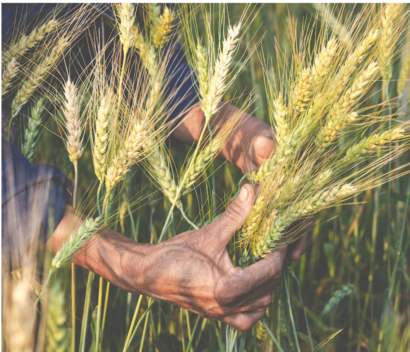
Agriculteur récoltant du blé.

Le portail Productivité de l'Eau grâce à l'Accès libre aux données dérivées de la Télédétection (Water Productivity through Open access of Remotely sensed derived data [WaPOR]) de l'Organisation des Nations Unies pour l'alimentation et l'agriculture (FAO), accessible au public, soutient le suivi de la productivité de l'eau agricole à l'échelle continentale, nationale et des bassins. Avec de nouvelles informations produites tous les 10 jours, le portail aide les utilisateurs à prendre des décisions éclairées en matière de politiques et d'investissements.