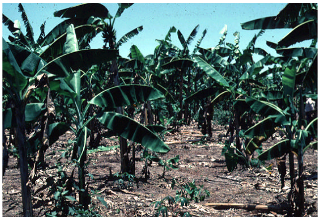
Falta de crecimiento y caída de bananos de altura de Africa oriental muy infestados por Pratylenchus goodeyi, Tanzania.

encuentra casi exclusivamente en pequeñas explotaciones y está generalmente ausente en plantaciones comerciales localizadas en las tierras bajas. Esto podría explicar el porqué esta especie no se ha difundido, de forma amplia, con el material vegetal comercial, como en el caso de R. similis y P. coffeae . No obstante, se corre el riesgo de que P. goodeyi se convierta en una importante plaga en las zonas de producción bananera de clima más templado de la cuenca mediterránea y de Medio Oriente, y es probable que se halle presente en zonas altas de otros países de Africa.