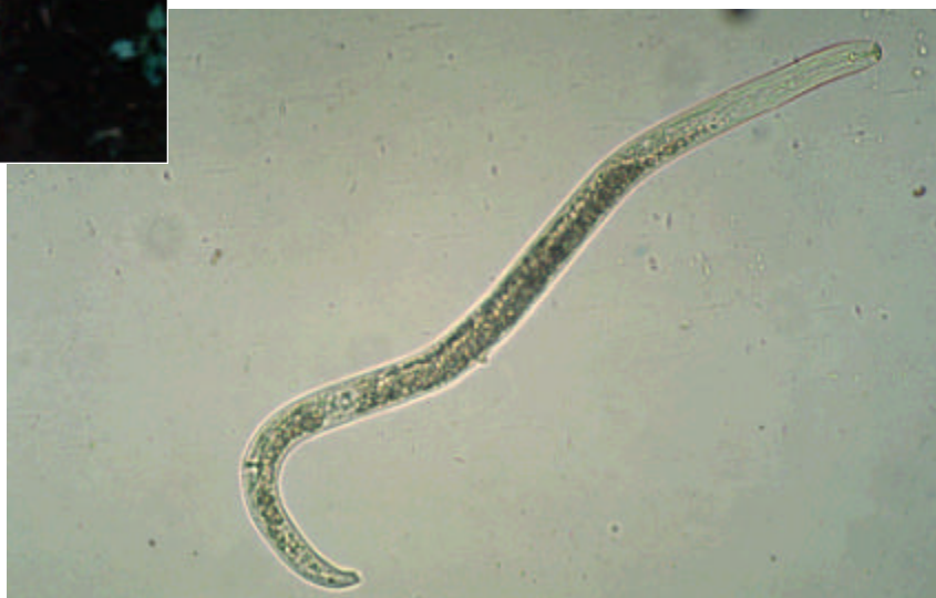
Hembra (izquierda) y macho (derecha) de P. Goodeyi.