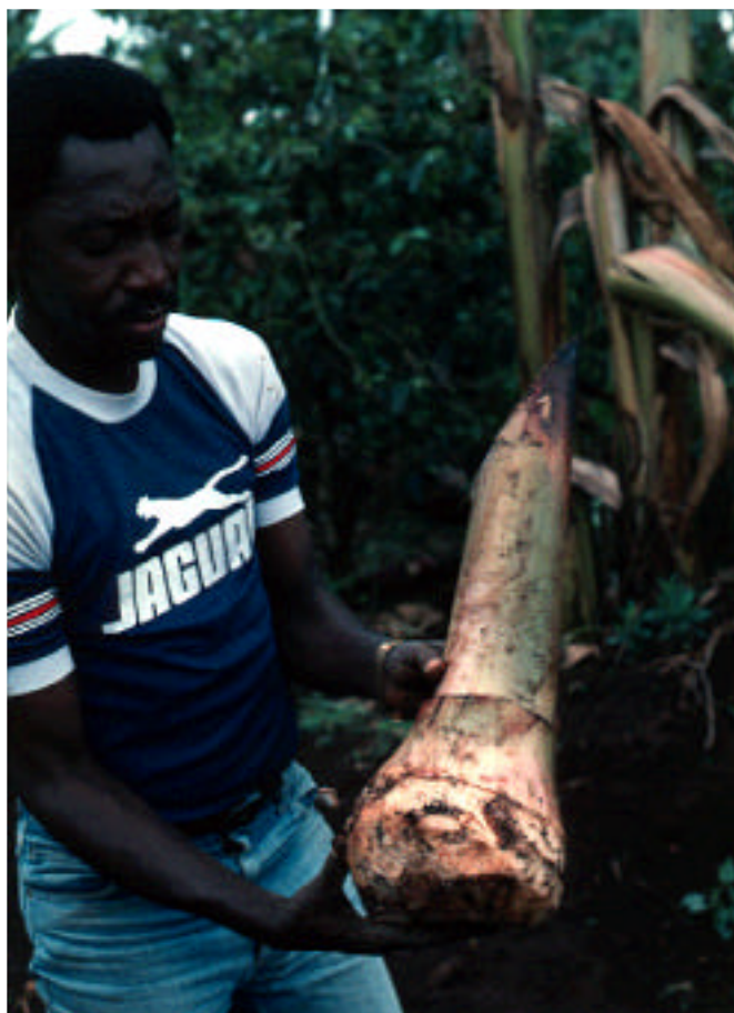
Retoño de plátano preparado para plantar, tras recorte y limpieza para erradicar Pratylenchus goodeyi , Tanzania.

P. coffeae parece multiplicarse bien en los cultivares de banano y plátano, incluso aquellos que han mostrado resistencia frente a R. similis . Se sabe que existe una diversidad biológica en esta especie. Se ha comprobado que ésta parasita el ñame en Uganda y en el Pacífico sin atacar las plantas adyacentes de bananos, lo que indica la existencia de diferentes razas biológicas. En cambio, se ha encontrado un mismo aislado de P. coffeae en el ñame y el plátano en Ghana. También existe una diversidad en P. goodeyi , cuyas poblaciones y daños varían mucho en función de los grupos y los cultivares de Musa . Pueden alcanzar un nivel elevado de parasitismo en grupos genéticos como Pelipita (ABB), Bluggoe (ABB) y Plátano (AAB), pero se hallan escasamente representado en otros grupos. Igualmente, existen diferencias entre los aislados geográficos de P. goodeyi . Así, en ciertas regiones de las tierras altas de