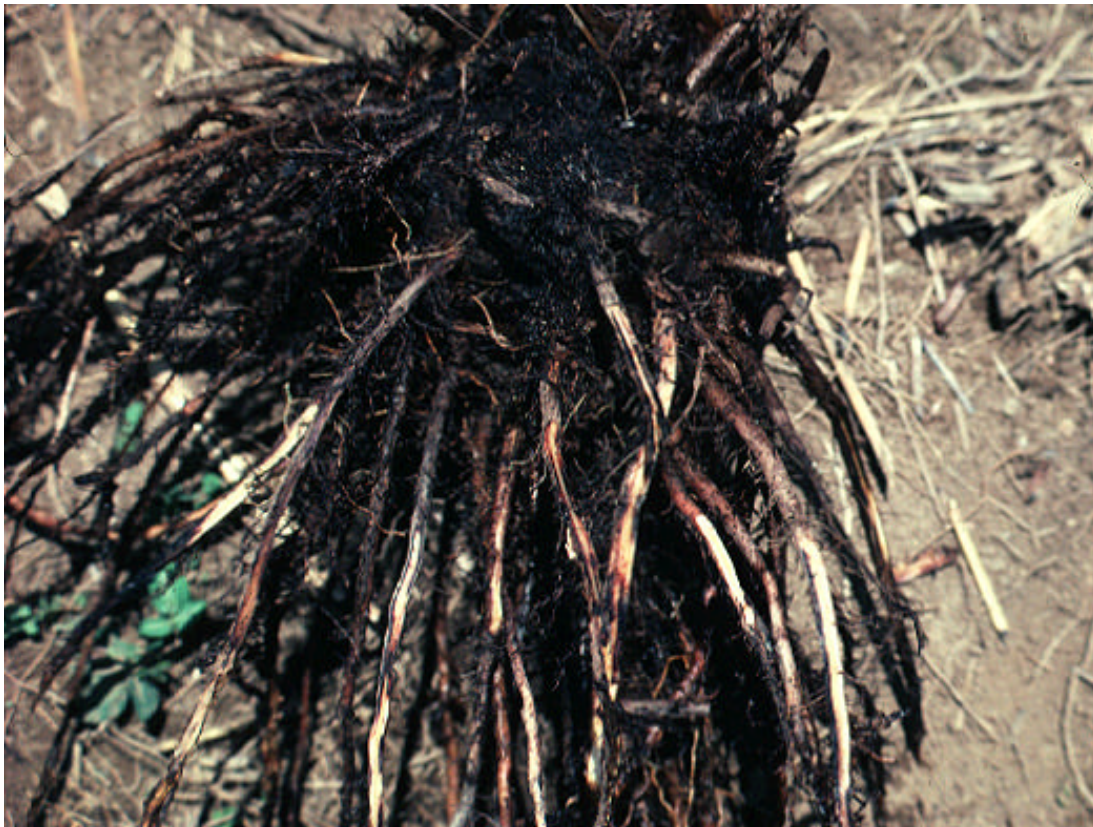
Necrosis negras en raíces de banano causadas por Pratylenchus coffeae, Papua Nueva Guinea.

y en el género Ensete en Etiopía. P. Goodeyi también es la principal especie de nematodo que parasita los bananos Cavendish en las Islas Canarias. Se encuentra también en Madera, en Egipto y en Creta. Fuera de estos lugares, sólo se ha observado su presencia en Australia (Nueva Gales del Sur). P. goodeyi se desarrolla en temperaturas más bajas que P. coffeae y R. similis , y su distribución se halla estrechamente ligada a la altitud y a las altas latitudes, que corresponden a zonas de producción bananera de climas más templados. En Camerún el límite inferior de altitud para el desarrollo de P. goodeyi está en los 700 metros sobre el nivel del mar, mientras que en Uganda, esta especie de nematodos es a menudo la única que parasita las raíces de bananos a 1500 metros sobre el nivel del mar, con densidades que pueden superar los 100 000 individuos por 100 g de raíces. En Africa oriental y occidental, P. goodeyi se