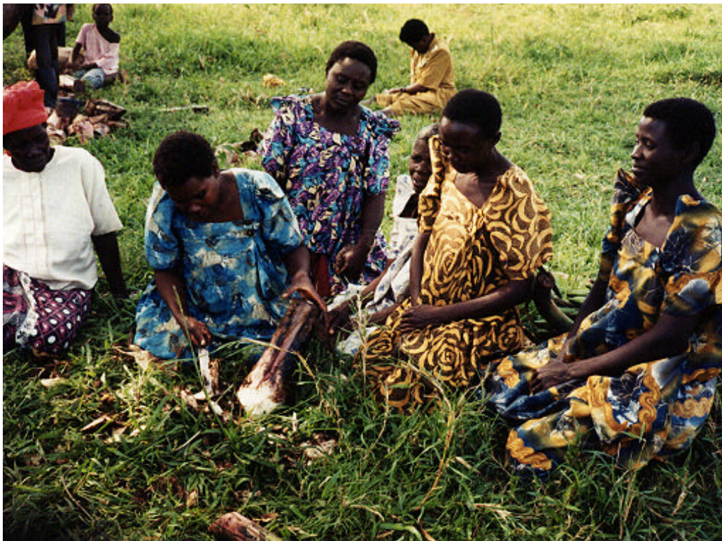
En Uganda, mujeres aprenden a pelar y limpiar los retoños.