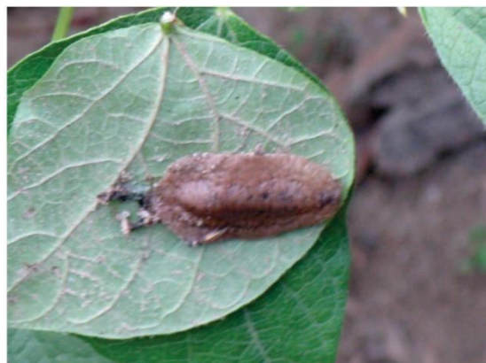
Figura 17. Babosa en frijol

Las babosas aumentan en número durante los primeros días de la época lluviosa y en postrera. Cuando las infestaciones son altas pueden destruir completamente toda la plantación en una sola noche.