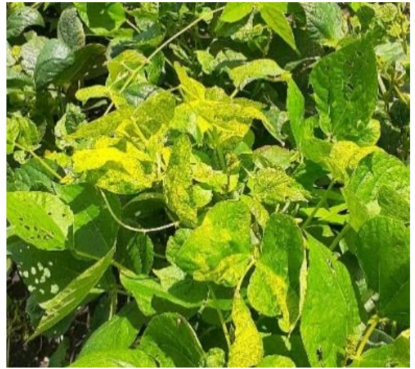
Figura 12. Síntoma de daño por virus del, mosaico dorado en frijol

Es la enfermedad más importante en el cultivo de frijol, es transmitida por el insecto Mosca blanca ( Bemisia tabaci ), la enfermedad no se trasmite por semilla. Esta enfermedad se registra en el país en condiciones ambientales de temperaturas medias de 18-25°C y altas de 28°C; altitudes no mayores de 1,200 msnm. Las plantas infectadas presentan en las hojas un color amarillo intenso, debido al desarrollo desigual de las áreas sanas y enfermas, las hojas pueden deformarse. Si las plantas han sido infectadas antes de la floración, hay aborto prematuro de las flores y deformaciones de las vainas. Las pérdidas por esta enfermedad pueden alcanzar hasta el 100%.