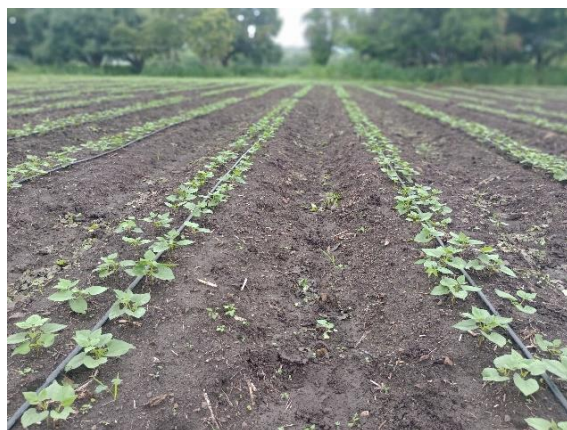
Figura 6. Área de frijoles sembrada en época de primera

Corresponde al primer ciclo productivo del año, generalmente inicia a mediados de mayo a junio y coincide con el inicio de la temporada de lluvias, es ideal para zonas de clima templado y suelos con buen drenaje. La ventaja de las siembras en este ciclo es por la disponibilidad de lluvias suficientes para una buena germinación y desarrollo temprano del cultivo, pero a la vez con el desafío de lluvias excesivas que pueden generar problemas de encharcamiento y enfermedades fúngicas.