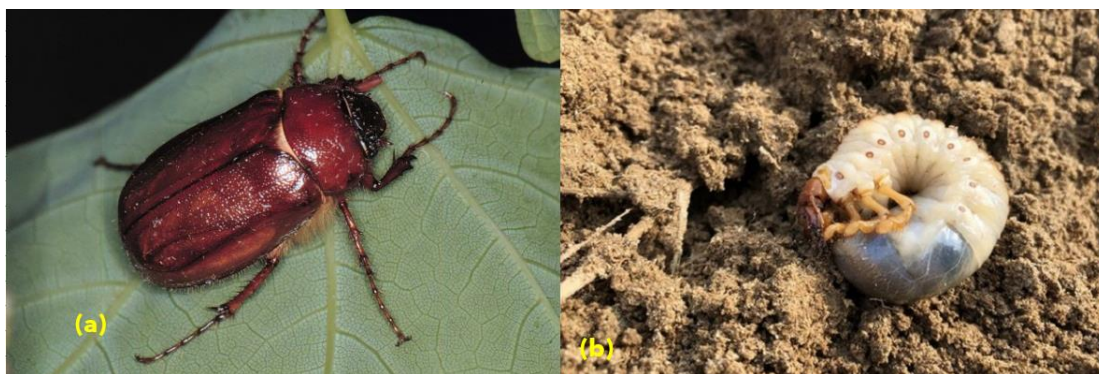
Figura 16. Gallina ciega, (a) adulto, (b) larva, estado que causa daño a los cultivos

Es la plaga del suelo de mayor importancia económica en Honduras, ya que ataca cultivos como maíz, frijol, arroz, caña de azúcar, hortalizas, pastos y otros. Las larvas atacan las semillas desde que comienzan a germinar, se alimentan de las raíces y de la base de los tallos de las plantas. En las áreas afectadas se observa mala germinación, plantas con poco desarrollo, coloración amarillenta, susceptibles al acame y marchitez en las horas más soleadas. En campos severamente afectados pueden ocurrir pérdidas hasta en un 100 % entre los 7 y 10 días de la germinación.