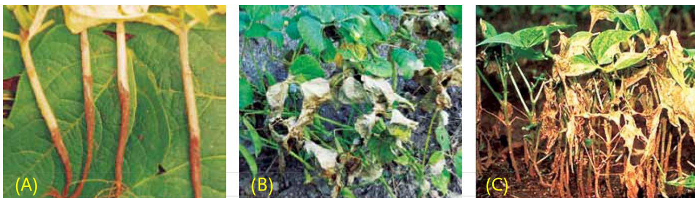
Figura 13. Síntomas de chancros de Rhizoctonia en el tallo (A) y manchas con hilos blancos y cafés con borde fino oscuro en el follaje de frijol (B y C).

alternos y tiene la capacidad de transmitirse por la semilla. Dependiendo del grado de severidad de la enfermedad la planta puede llegar a morir.