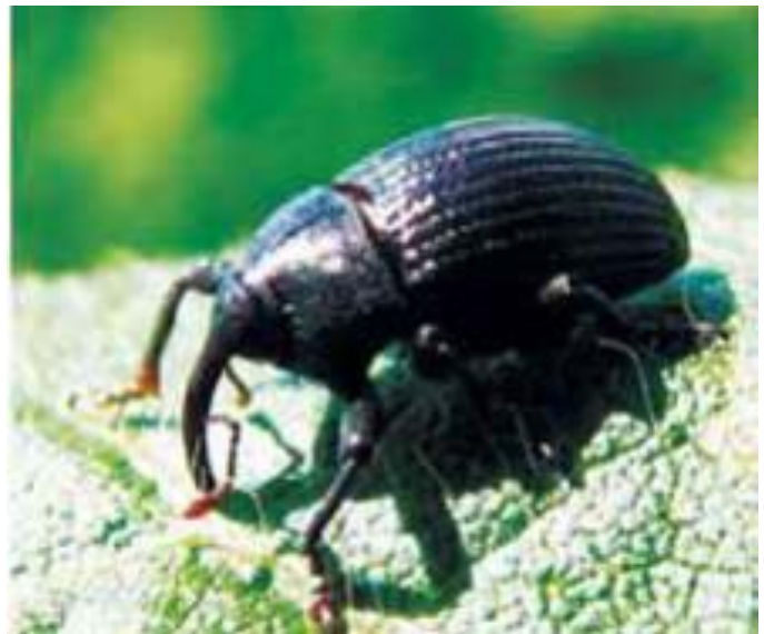
Figura 21. Adulto del picudo de la vaina

El daño principal lo ocasionan las larvas que se alimentan de las semillas; al poner los huevos ocasionan daños en las vainas, provocando cicatrices circulares de color amarillo y malformaciones. Estos insectos pueden reducir los rendimientos y la calidad de la semilla en forma considerable.