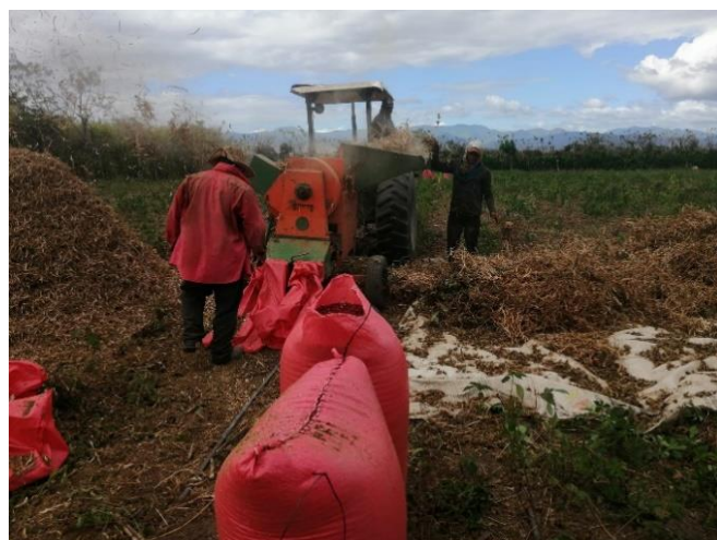
Figura 25. Proceso de desgrane del frijol.

Al realizar esta práctica debe procurar causar el menor daño posible al grano. Una de las formas más recomendables es agrupar las plantas sobre manteados o lonas y golpearlas con palos. Es apropiado hacer esto en días soleados, bastará dejar pasar de 4 a 5 días para iniciar la trilla o aporreo. Si el tiempo está lluvioso, recoja las plantas en el campo y protéjalas con plástico negro o almacénelas en una galera o secadora. Si la trilla se hace con un contenido de humedad muy elevado (20% o más) ocurre aplastamiento y daños internos al grano, si se efectúa cuando el contenido de humedad es muy bajo (14%) se obtendrán grandes cantidades de grano partido, fisurado, con cotiledones desprendidos y embriones partidos. Lo recomendable es que el grano de frijol tenga una humedad entre 15 a 17% al momento del desgrane.