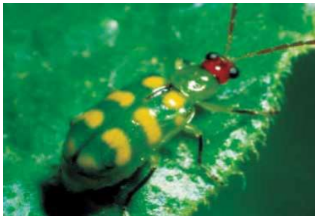
Figura 19. Adulto de diabrotica spp.