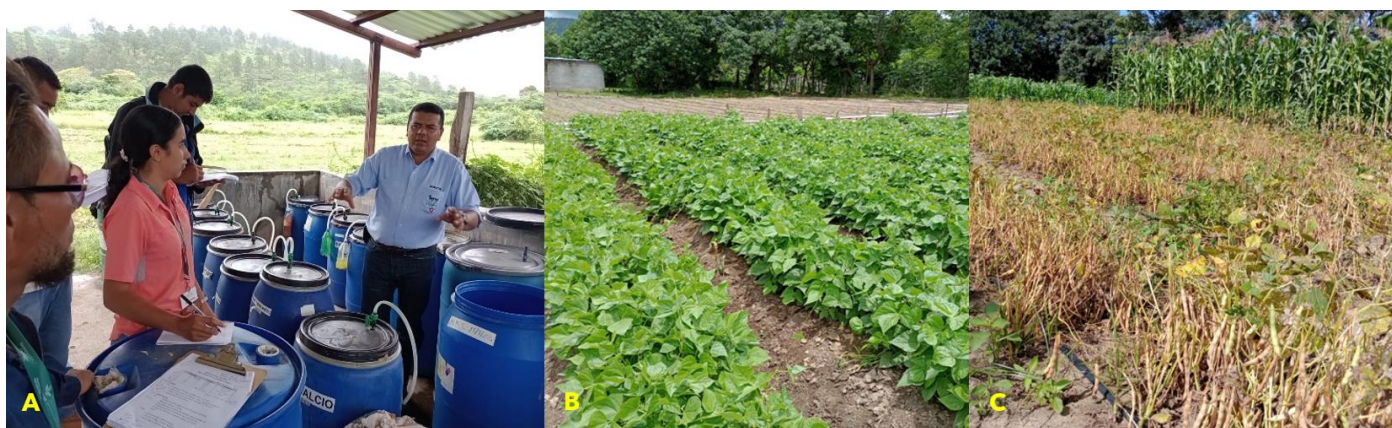
Figura 10. (A) Profesor de INFOP impartiendo capacitación en bioinsumos a técnicos de ARSAGRO, (B y C) Parcelas de frijol evaluando productos (bioinsumos) generados en la biofábrica.