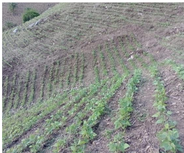
Figura 7. Área de frijoles, sembrada en época de postrera, en ladera, Danli, El Paraíso

Período de siembra comprendido a finales de agosto a principios de septiembre, representa el 70-80 % del área total sembrada por año agrícola, se aprovechan las lluvias moderadas de la segunda parte de la temporada lluviosa y es la época más importante para el cultivo de frijol en Honduras, principalmente por la menor presión de plagas y enfermedades, además las lluvias moderadas favorecen la floración y el llenado de vainas y el periodo de cosecha coincide con época de nada o baja precipitación.