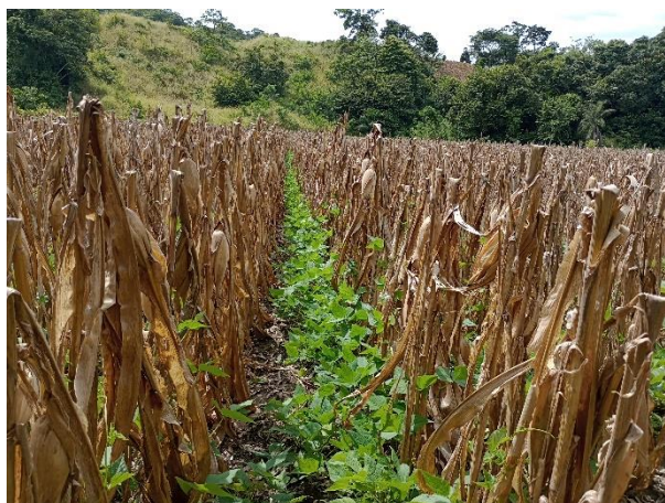
Figura 9. Área de frijoles en relevo, Valle de Jamastrán, Danli, El Paraíso

Es una práctica común en Honduras que consiste en sembrar frijol justo en la etapa de cosecha del maíz, se hacen en la última semana de agosto hasta el 15 de octubre, aprovechando la humedad residual y los nutrientes que el maíz dejó en el suelo. Este sistema es eficiente y sostenible, especialmente en la región de Postrera, donde las lluvias moderadas permiten el desarrollo del frijol después de la temporada del maíz. Fig. 9. La siembra de relevo es muy importante para zonas maiceras, como los valles de Jamastrán en El Paraíso; Siria y Talanga en Francisco Morazán; Sulaco y Yorito en Yoro; Guayape y Lepaguare en Olancho; La Entrada en Copán; Comayagua; Santa Bárbara y otras zonas del país.