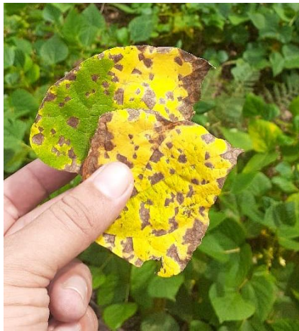
Figura 14. Síntoma de daño en forma de ángulo de mancha angular en las hojas del frijol.

En la vaina, los síntomas iniciales se observan como pequeñas manchas circulares de color rojo marrón, éstas aumentan hasta convertirse en manchas grandes que se unen entre sí, causando vainas mal formadas, generalmente con poca o ninguna semilla o semillas pequeñas, arrugadas, mal formadas y manchadas.