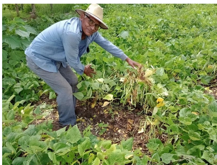
Figura 4. Variedad de frijol SEF 70, parcela de validación, Danli, El Paraíso

Las variedades mejoradas de frijol liberadas en Honduras provienen de materiales facilitados por el Centro Internacional de Agricultura Tropical (CIAT) de Colombia y el Programa Regional de Frijol (PROFRIJOL), y las que han sido generadas en Honduras, a través de las actividades de mejoramiento genético llevadas a cabo en Zamorano desde 1988. Estas variedades han sido liberadas con el fin de proveer alternativas a los productores de utilizar variedades adaptadas a factores diversos de clima, suelo, enfermedades, plagas y preferencias de consumo familiar y mercado.