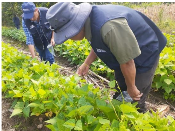
Figura 20. Muestreo en frijol