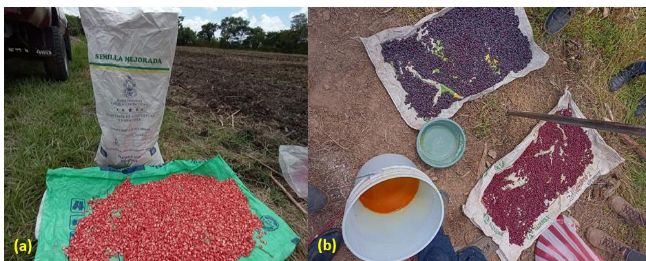
Figura 5. (a) Tratamiento de semilla antes de siembra, utilizando producto sintético, (b) uso de producto ecológico (caldo sulfocalcico)

Tratar la semilla con productos ecológicos también es otra alternativa excelente que protege a la semilla de manera sostenible y amigable con el ambiente. En occidente de Honduras se ha trabajado con áreas de validación (MAPANCE), haciendo tratados de semilla con insumos ecológicos como caldo sulfocalcico, (Azufre + cal) y la utilización de ceniza de madera, únicamente envolviendo la semilla con una capa ligera antes de la siembra.