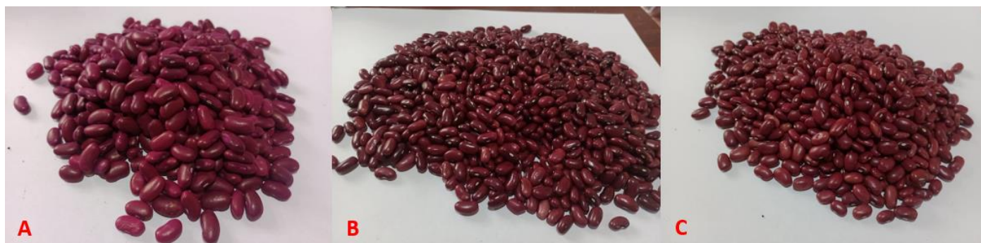
Figura 3. Variedades de frijol liberadas por DICTA (A=Honduras nutritivo, B=rojo chortí, C=paraisito mejorado)

Las variedades mejoradas de frijol liberadas en Honduras provienen de materiales facilitados por el Centro Internacional de Agricultura Tropical (CIAT) de Colombia y el Programa Regional de Frijol (PROFRIJOL), y las que han sido generadas en Honduras, a través de las actividades de mejoramiento genético llevadas a cabo en Zamorano desde 1988. Estas variedades han sido liberadas con el fin de proveer alternativas a los productores de utilizar variedades adaptadas a factores diversos de clima, suelo, enfermedades, plagas y preferencias de consumo familiar y mercado.