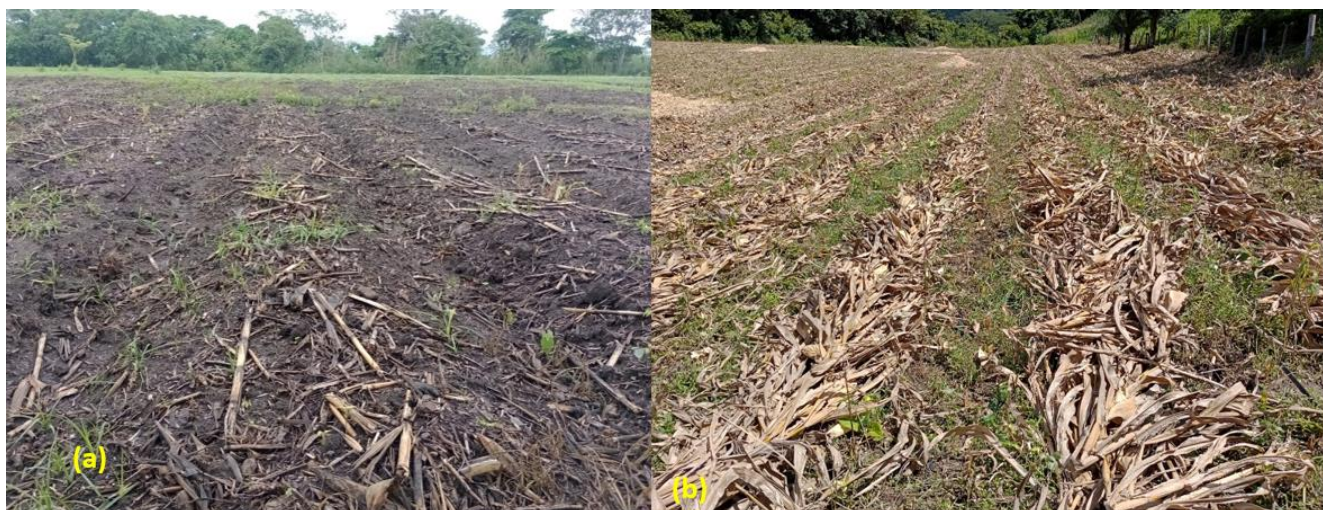
Figura 2. (a) Camas permanentes anchas y (b) distribución de rastrojos