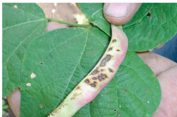
Figura 15. Síntoma de daño por antracnosis en vainas de frijol.

La Antracnosis del frijol es causada por el hongo Colletotrichum lindemuthianum . Es muy frecuente en localidades con clima fresco a fríos y alta humedad relativa. La enfermedad es favorecida a temperaturas entre 13 y 26°C, con una óptima de 17-18°C y lluvias moderadas a intervalos frecuentes. Las lluvias acompañadas de vientos son favorables para la diseminación de las esporas del patógeno a corta distancia. Es frecuente en localidades con