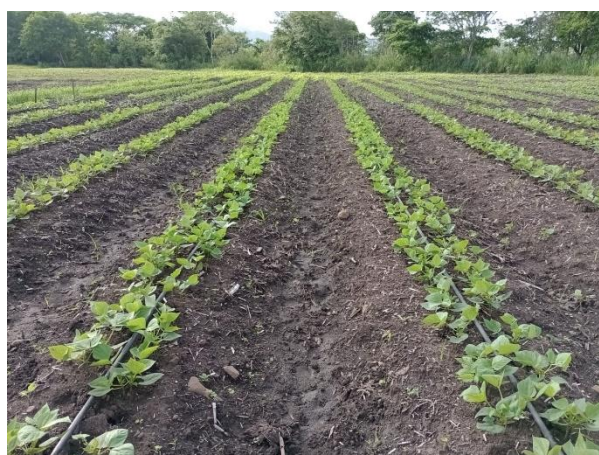
Figura 8. Área de frijoles en monocultivo, Valle de Jamastran, Danli, El Paraíso

A través de la iniciativa AgriLAC se ha trabajado con enfoque en fortalecer las prácticas agronómicas y diversificación de los sistemas de cultivos, fomentado la asociación de cultivos para mejorar los rendimientos, la sostenibilidad y la resiliencia de los sistemas productivos, esto se ha logrado a través de trabajos con organizaciones de productores en la implementación de áreas de validación y módulos comparativos tanto en oriente como en occidente.