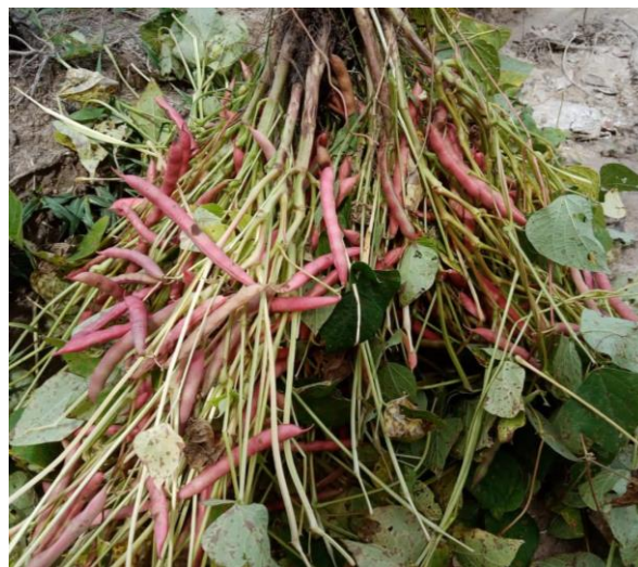
Figura 24. Frijoles en su madures fisiológica.