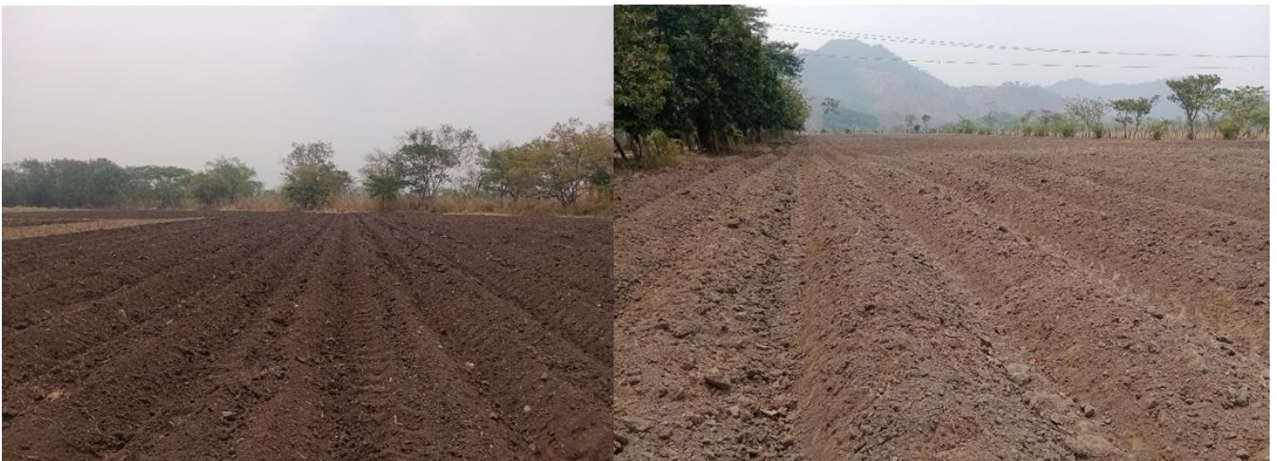
Figura 1. Preparación de suelo mecanizado, previo a la siembra de frijol.

La preparación de suelos varía según el sistema de siembra. Para la siembra en monocultivo con un sistema de producción tecnificado se recomienda una aradura entre los 20-40 cm de profundidad para incorporar los residuos de cosecha; con uno o dos pases de rastra, finalmente nivelando el terreno (Escoto, 2015) (DICTA, 2019). Para siembras en relevo ( generalmente con maíz ), si no se ha hecho un buen control de malezas en maíz, Escoto (2015) recomienda hacer una chapea ligera 10 días antes de la siembra, aplicar herbicida y luego sembrar.