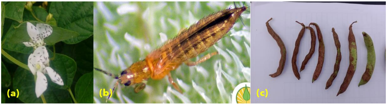
Figura 22. Megalurotrips en flor de frijol, (b) Adulto de Trips y (c) dano en vainas de frijol