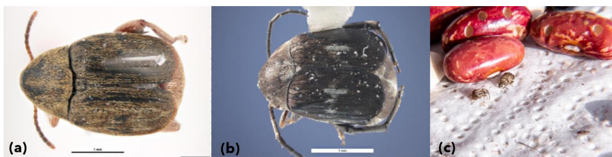
Figura 23. (a) Adulto de Aconthoscelides obtectus , (b) Adulto de Zabrotes subfasciatus y (c) daño en grano de frijol