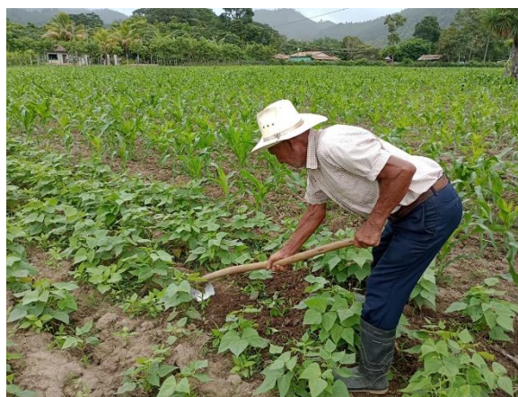
Figura 11. Manejo manual de malezas en granos básicos, El Barro, Danli, El paraíso.

Es el método más común en áreas pequeñas o de subsistencia. Implica eliminar las malezas a mano o con herramientas simples (como machetes o azadones). Este control debe realizarse de forma regular, especialmente cuando las malezas son jóvenes y fáciles de eliminar. Se recomienda hacer el deshierbe antes de que las malezas lleguen a la etapa reproductiva para evitar que se diseminen sus semillas. Actualmente el manejo manual es un desafío por la escasa mano de obra en la mayoría de los sectores productivos del país.