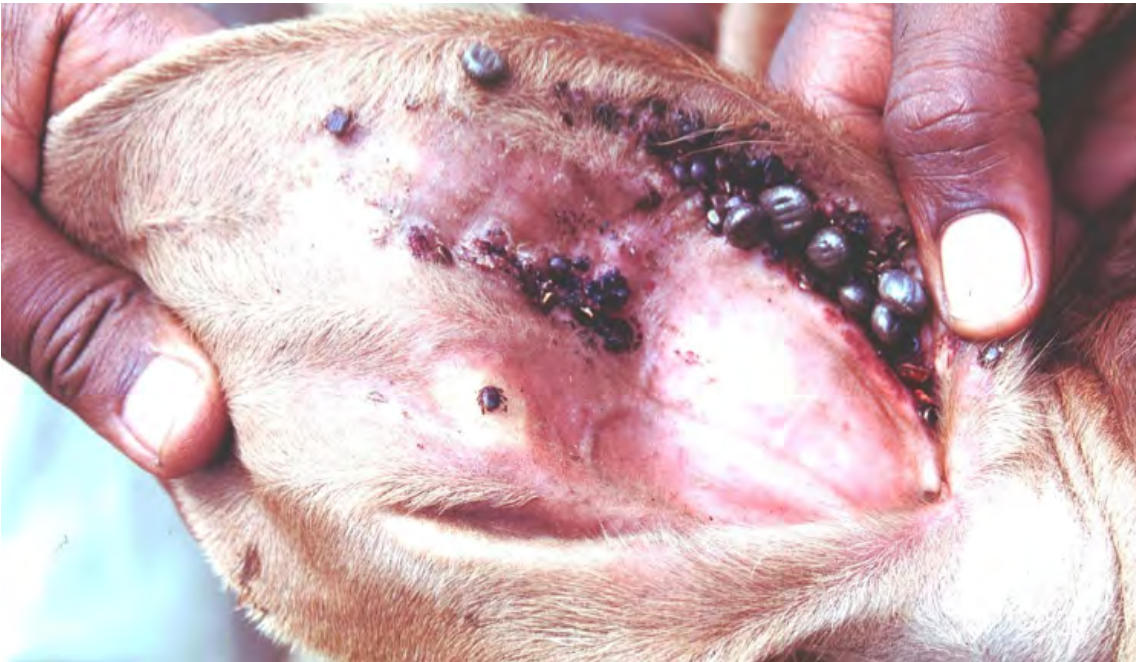
Figure 1: Tiques brunes ( Rhipicephalus appendiculatus ) sur l'oreille d'un bovin (Chaka, 2023).

La theilériose est transmise au bétail par la tique (« tique brune de l'oreille ») infectée par T. parva lorsqu'elle se fixe au bétail et commence à sucer le sang. Son site de prédilection d'attachement au bétail se trouve dans l'oreille, d'où son nom. Les parasites sont injectés dans le bétail dans la salive de la tique.