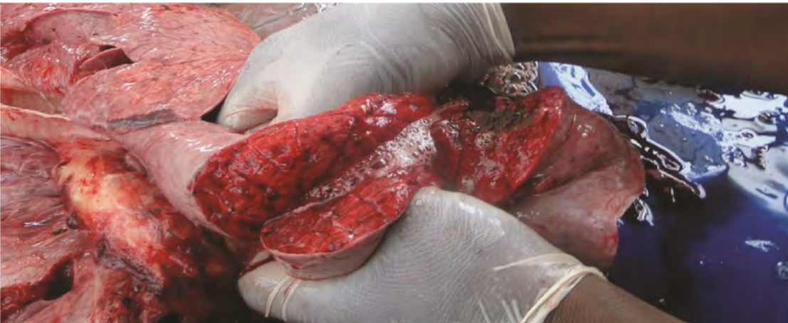
Figure 4: Les corps bleus de Koch