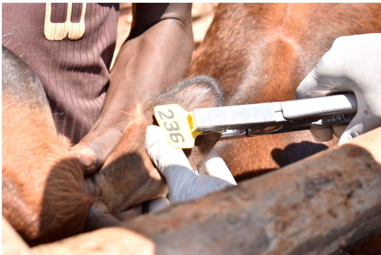
Figure 7: Marquage par la boucle d'oreille après vaccination contre la theilériose