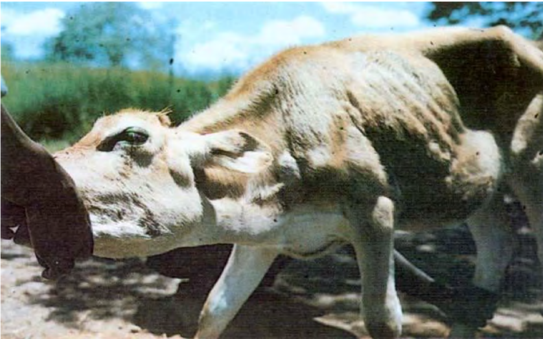
Figure 2: Bovins avec des ganglions préscapulaires et parotidiens enflés (voir flèches)

D'autres signes peuvent inclure un larmoiement, une opacité cornéenne, un écoulement nasal, une toux ; diarrhée ou matières fécales sèches ; muqueuses pâles (anémie) ou jaunisse et la mortalité chez les bovins exotiques peut atteindre 100% si aucun traitement n'est fait.