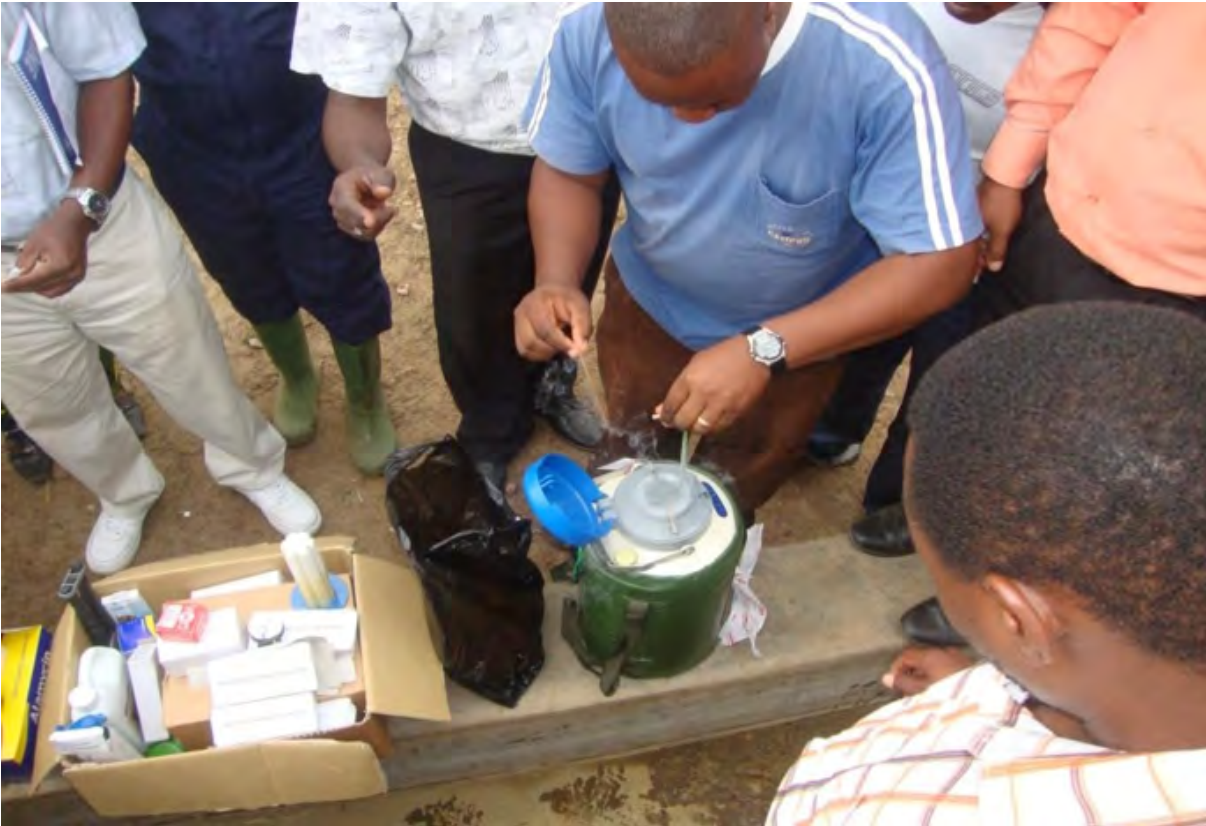
Figure 8: Paillette de cocktail Muguga placée dans une cuve de l'azote liquide à -196^{\circ}\text{C}

Le vaccin est composé de stabilat de sporozoïtes infectieux « Muguga cocktail » préparé à partir de tiques adultes et conservé dans une paillette placée dans un canister stocké dans de l'azote liquide à -196^{\circ}\text{C} (Figure 8).