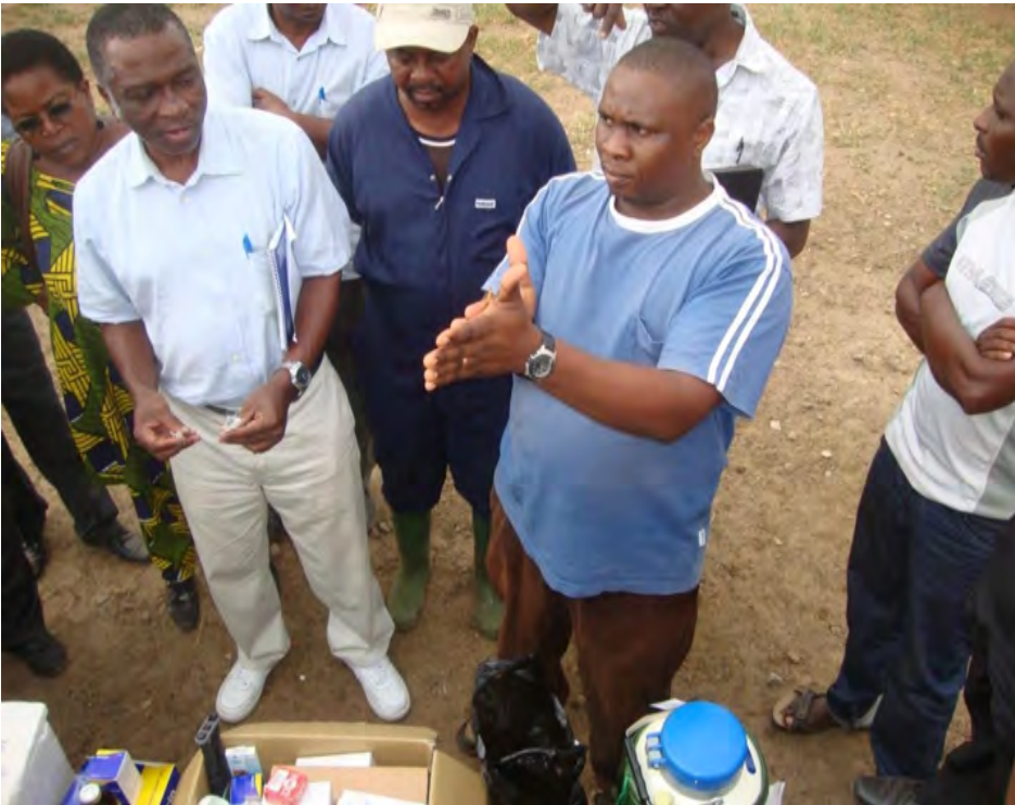
Figure 9: Roulement de la paillette et du stabilat entre les paumes de la main

iv. Équilibrage du vaccin : Le flacon est alors placé sur la glace (accumulateur de froid) pendant 30 minutes pour son équilibrage (Figure 10). Après ceci, le vaccin est prêt pour être administré.