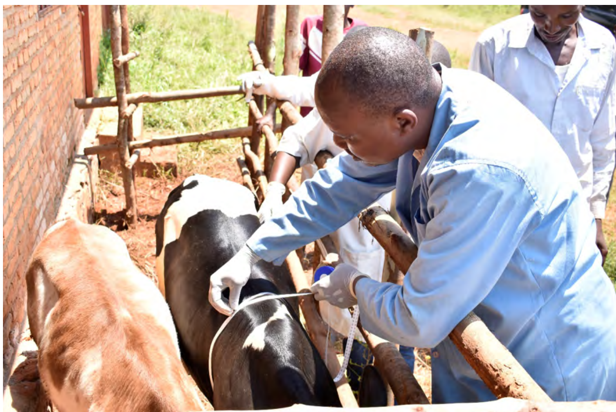
Figure 6: Mesure du poids d'un bovin à l'aide d'une bande du ruban zoo métrique