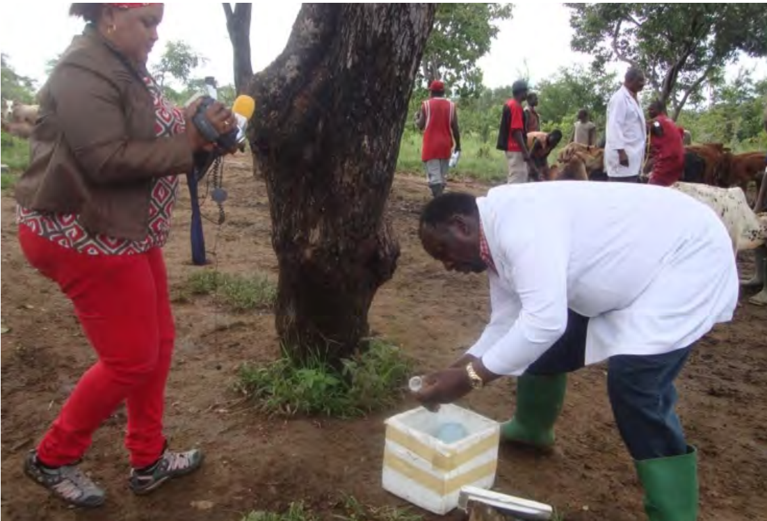
Figure 10: Glacière contenant de la glace pour conserver le vaccin contre la theilériose pendant la séance de vaccination

iv. Équilibrage du vaccin : Le flacon est alors placé sur la glace (accumulateur de froid) pendant 30 minutes pour son équilibrage (Figure 10). Après ceci, le vaccin est prêt pour être administré.