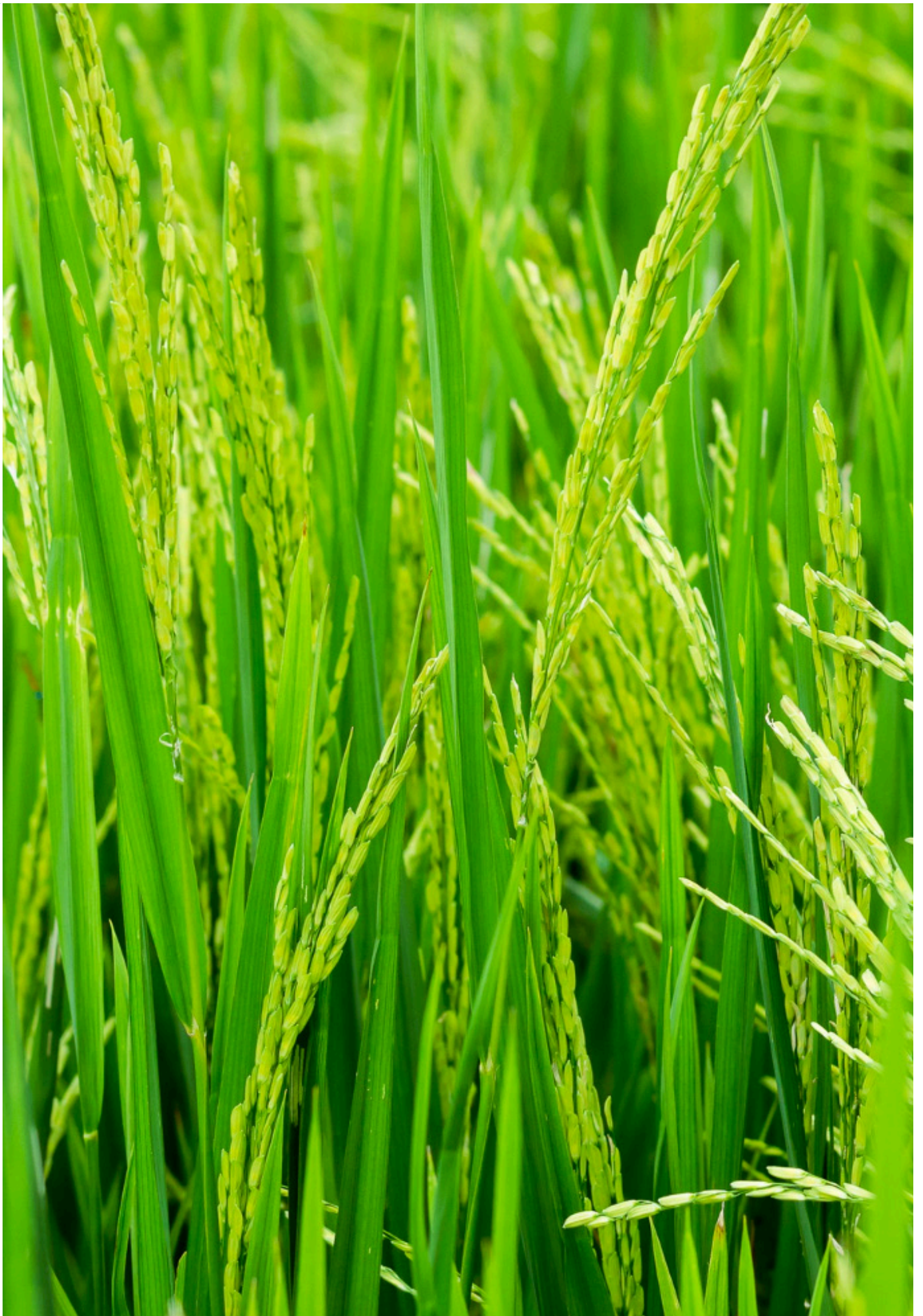
Champ de riz