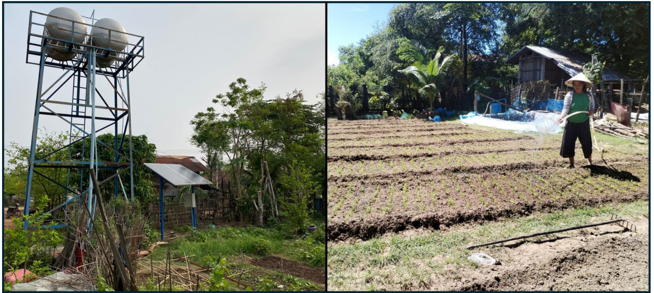
ຮູບທີ 2. ໂຄງສ້າງພື້ນຖານລະບົບ SWP (ຮູບເບື້ອງຊ້າຍ). ການນໍາໃຊ້ນໍ້າເຂົ້າໃນສວນຜັກຂອງສະມາຊິກ WUG (ຮູບເບື້ອງຂວາ)