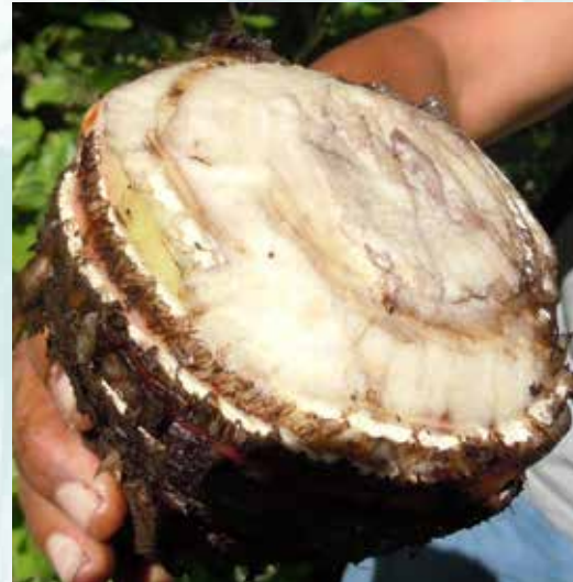
الخلايا سيئة التجهيز، تنتج نباتات قليلة من البراعم الجانبية (ش س)