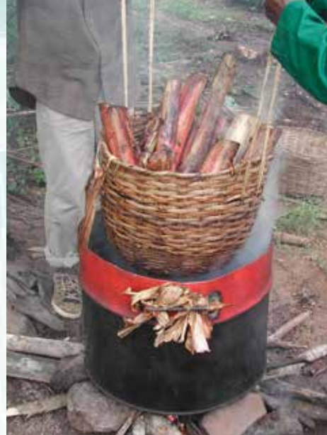
المعالجة بالماء المغلي (د ك)