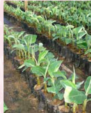
كورمات صغيرة (ب ش)