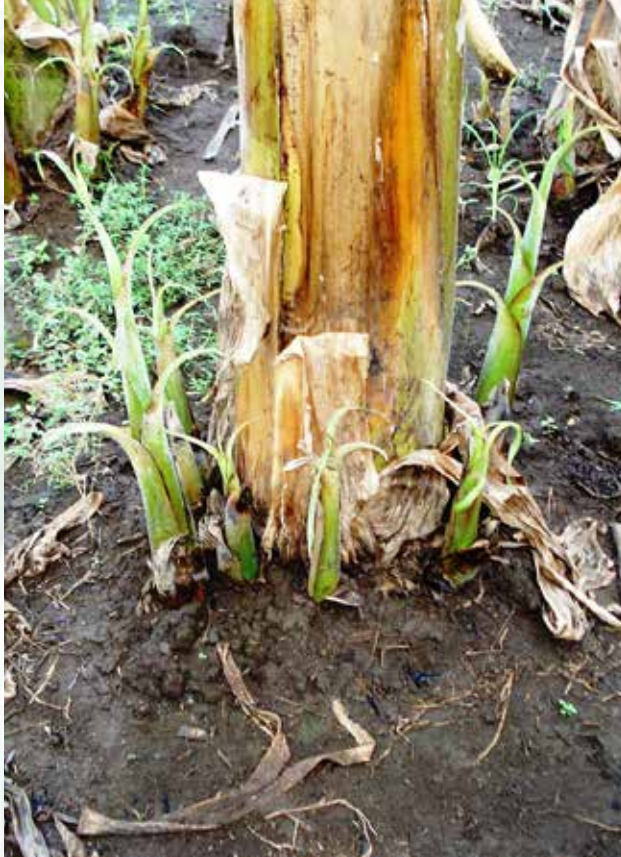
خلفات صغيرة بادئة (ب ش)

عند إنشاء حقل جديد قد يحتاج المزارع من مئات إلى آلاف الخلفات أو إلى مواد زرع أخرى، فكلما كانت المواد المزروعة موحدة العمر و الحجم كلما كان الحصاد مركز في الوقت بين 2 - 5 أشهر أو أكثر. إذا كانت مواد الزرع ذات حجم مختلف أو إذا أستغرق الزرع مدة تتراوح بين شهر إلى ثلاثة أشهر يتسع الحصاد على مدة أطول.