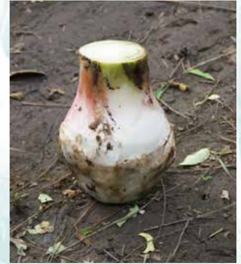
خلفة مقشورة جيداً (ب ش)