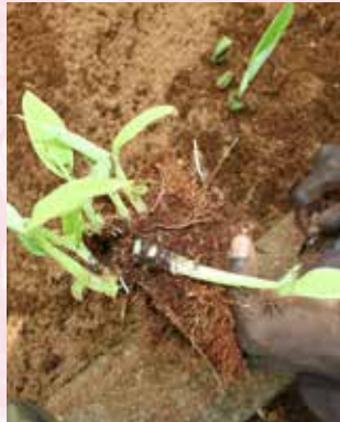
براعم جانبية (ت ل)