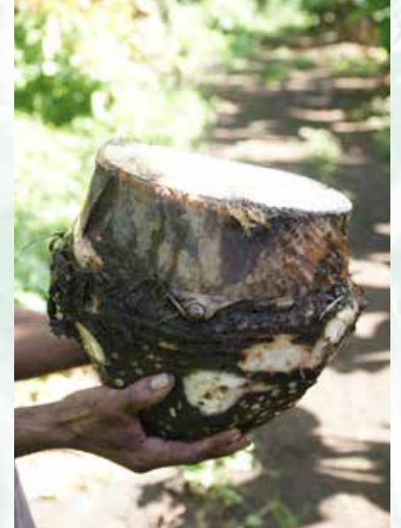
كورمة متوسطة مجتثة من الارض (ب ش)