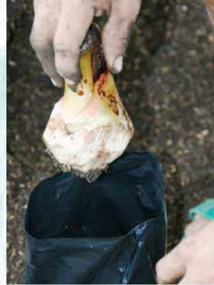
الخلفات المقشرة تزرع في اكياس في المشتل بإستخدام تربة نظيفة (ب ش).