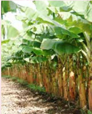
الجمع بين طرق عديدة (ب ش)

إن اكبر التحديات لإنتاج مواد الزرع ذات جودة عالية و خالية من الأمراض تتمثل في البداية على اختيار التقنية الملائمة لتجنب المشاكل التي تسببها الأمراض و الآفات المحلية ثم تخطيط إكثارالنباتات لتكون جاهزة عند حلول وقت الزرع. هذا مهم بالخصوص للزراعات المروية بالأمطار، حيث تكتمل الزراعة فقط خلال بضعة أشهر من العام. فيما يلي عدة برامج إكثار تجمع بين تقنيات مختلفة أُشير إليها من قبل في هذا الدليل، هذه البرامج تعطي بصفة عامة إرشادات عن الوقت اللازم و فعالية الإكثار. إعتماداً علي خدمة البني التحتية والارض وتكلفة العمالة ربما تكون الخيارات في بعض المناطق أكثر فاعلية وربحية عن مناطق أخرى.