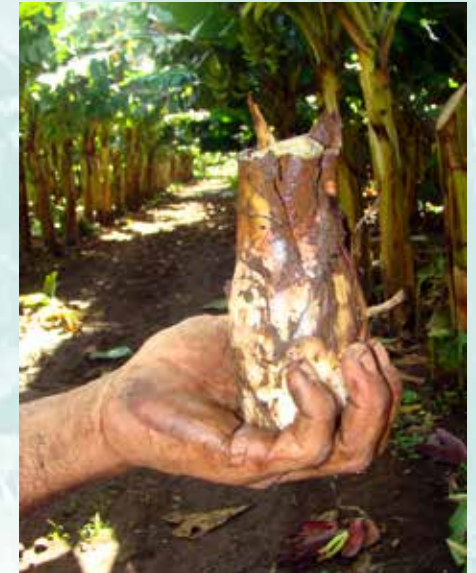
كورمة صغيرة جدا (غير مقبولة) (ب ش)