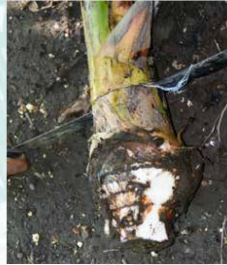
تقشير غير كامل (ب ش)