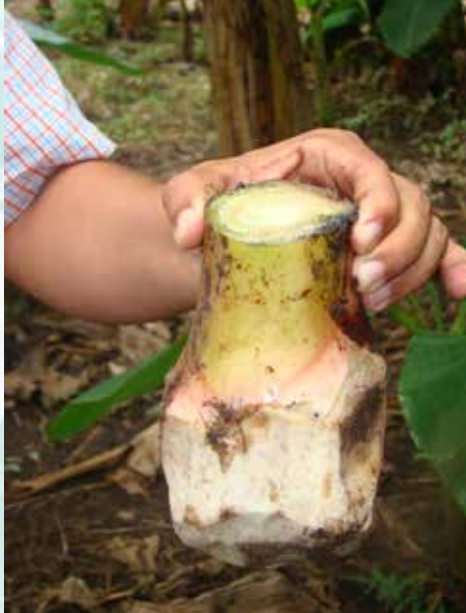
الخلفات بعد المعالجة بالماء المغلي (ب ش)