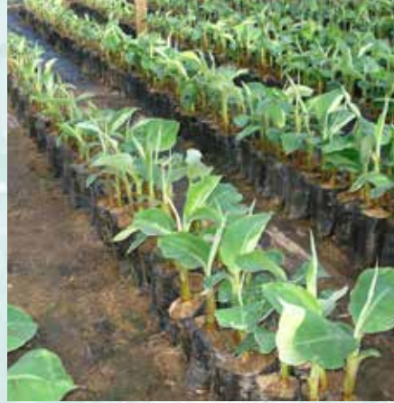
يتم تصنيف النباتات و فصلها إلى فرق متجانسة. تزال النباتات الغريبة والمريضة و الغير قوية. (ش س).