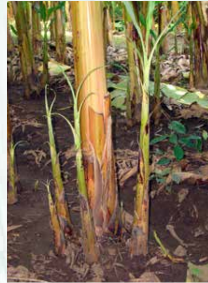
خلفة سيفية كبيرة (ب ش)