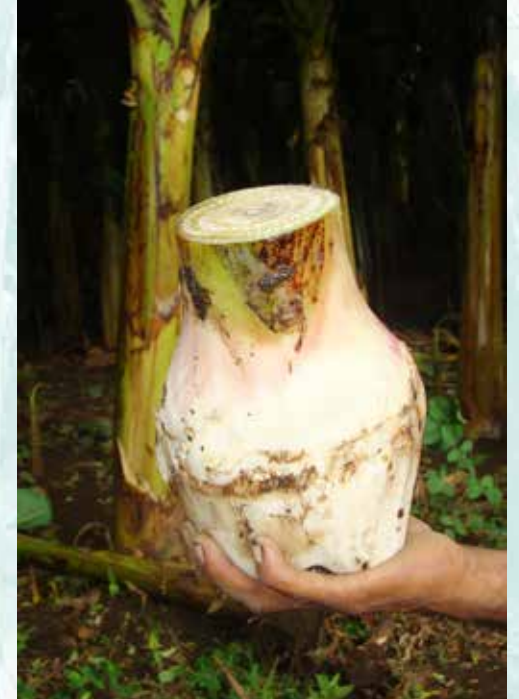
مواد زرع مفضلة (ب ش)