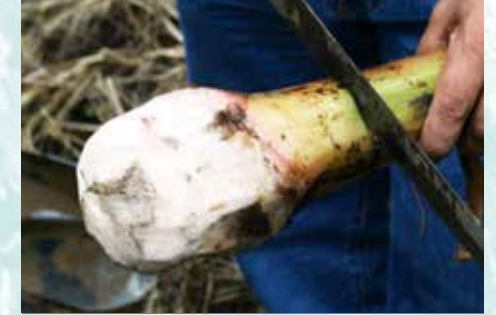
الخلفات الصغيرة تقشر اولاً (ب ش).