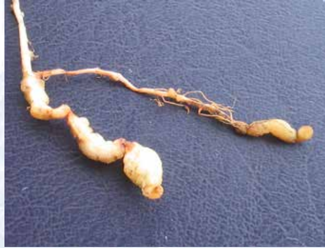
النيماتودا العقدية تتسبب في تشوه الجذور (م ت ن).

النيماتودا ديدان صغيرة تعيش في جذور النبات والتربة وهي غير مرئية للعين المجردة و لكنها تسبب أضرار خطيرة في المزارع. النيماتودا تتسبب في ضعف المجموع الجذري و يمكن أن تؤدي إلى سقوط نبات الموز والسباط مازالت صغيرة. عندما تكون الإصابة حادة شديد، يمكن للنباتات أن تسقط قبل تكون السباط (ب ش).