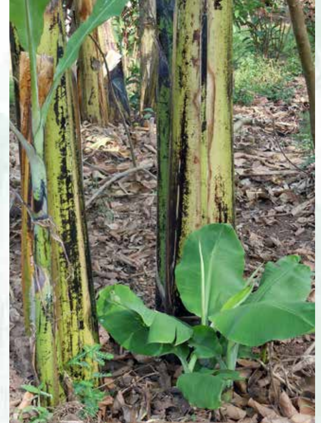
خلفة مائية (ش س)

إضافة إلى حجم و عمر مواد الزرع يمكن أن تظهر إختلافات حسب أصناف أو أنواع الموز اعتماداً على الأهداف، ففي مزرعة للاستهلاك العائلي يفضل تنوع الأصناف للإستهلاك المحلي أو إختيار أصناف على مستوى عالي التجانس لحصد كمية كبيرة من نوع واحد في فترة قصيرة.