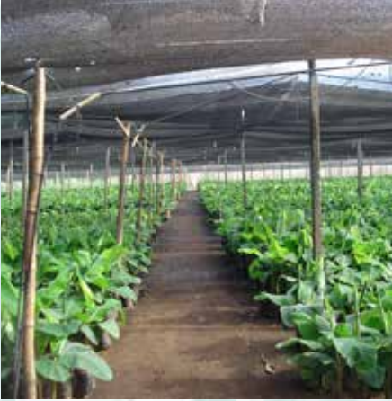
خفض الظل تدريجيا إلى الصفر قبل النقل النهائي إلى الحقل (ل ب)