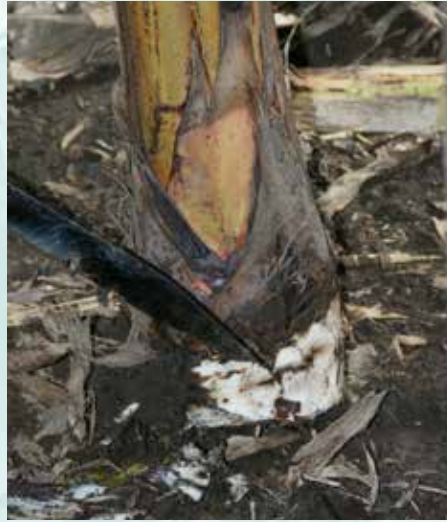
بقايا الأنفاق المحفورة من سوسة الموز (ب ش)