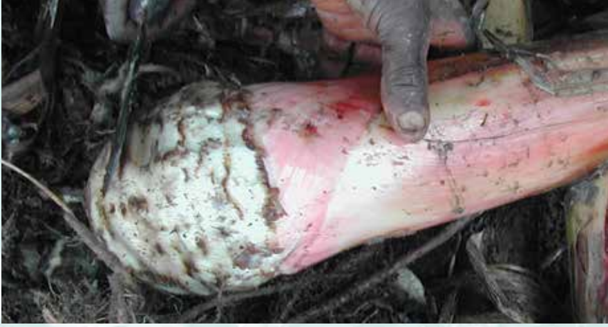
مواد زرع مقبولة (د ك)