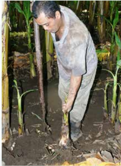
خلفة سيفية صغيرة (ش س)

يمكن لوحدة منتجة لمحصول اول، أن يكون بها خلفات ذات حجم مختلف، حتى الخلفات المائية والخلفات البادئة يمكن استخراجها منها و غرسها في المشتل. الساق الكاذبة الكبيرة يمكن أيضا اجتنائها من التربة قبل الازهار او بعد حصادها (ب ش).