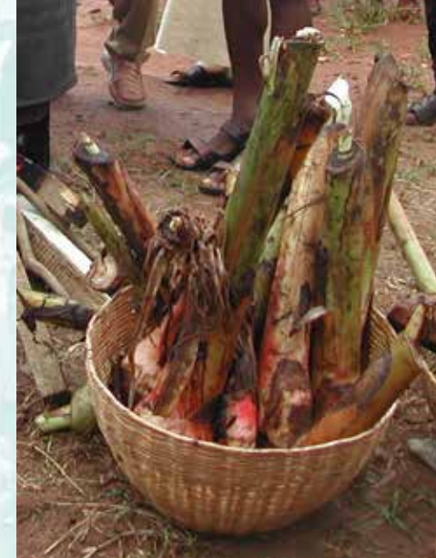
خلفات جاهزة للغمس في ماء مغلي (د ك)