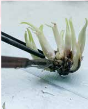
نباتات المختبر (م إ)