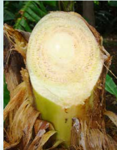
لون غير طبيعي في القطع العرضي للساق (غير مقبولة) (ب ش)