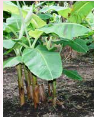
إكثار كورمات في قطع ارض (ب ش)