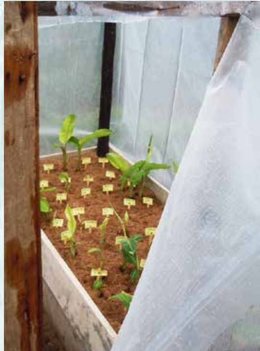
نمو البرعم الرئيسي يمنع نمو البراعم الجانبية ( ش س )