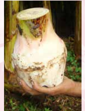
كورمات (ب ش)