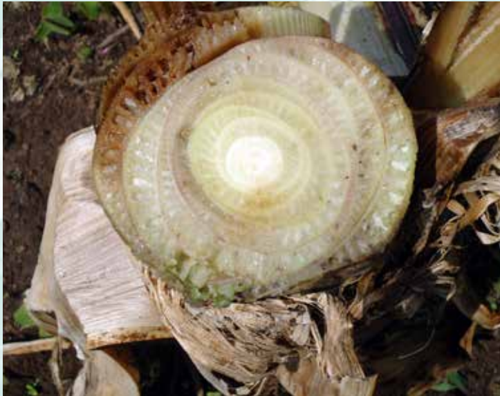
وجود إفرازات (غير مقبولة) (س م)