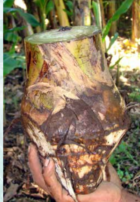
مواد زرع مقبولة (ب ش)